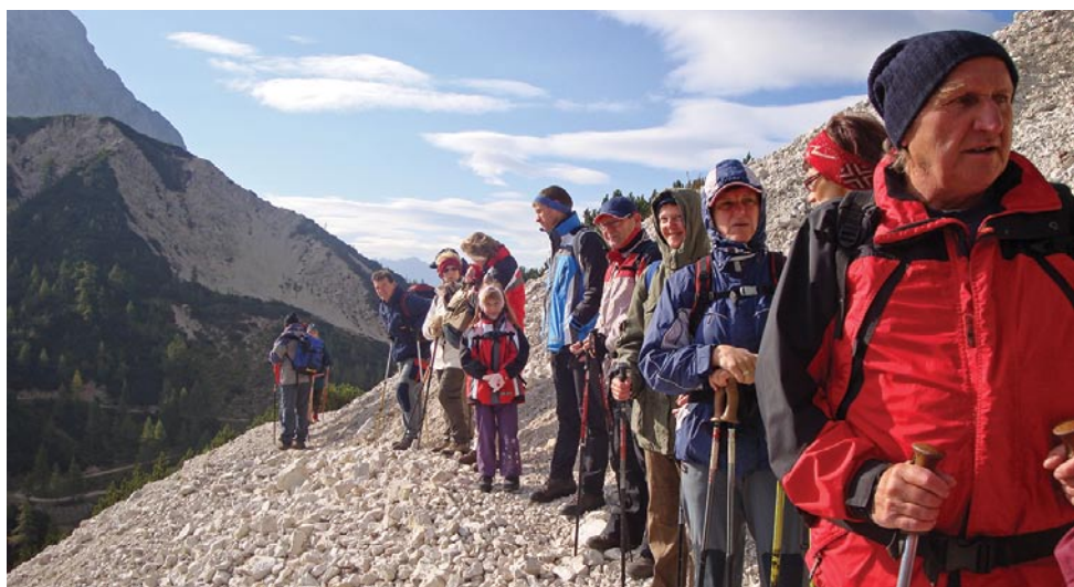
Slemenova špica 2008 - izlet starejših članov