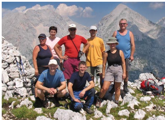
Kalški greben (2007)