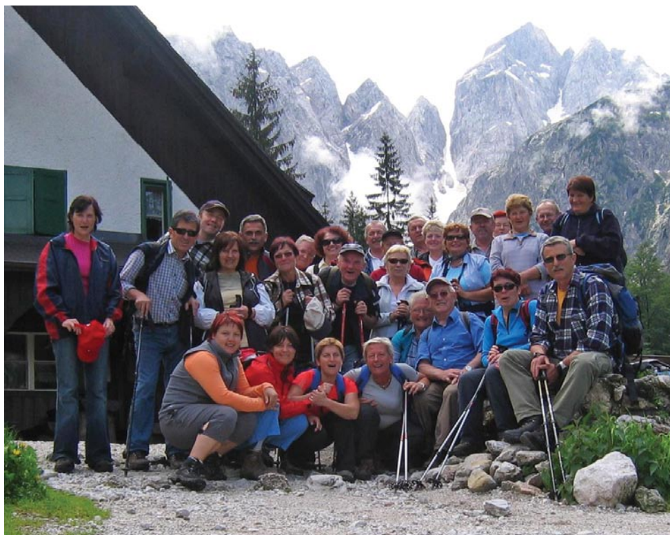
Tamar 2007 - izlet starejših članov