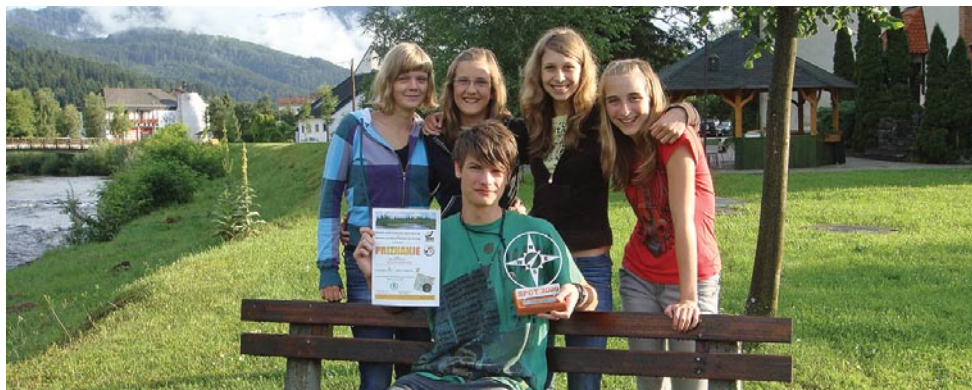
Zmagovalna ekipa SPOT-a 2009 na Pohorju