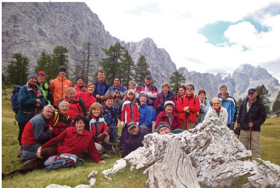
Slamenova špica (2008)

Planinsko društvo Nazarje že od same ustanovitve vsak mesec organizira planinski izlet ali turo. Naše vodilo že od samega začetka delovanja društva je, da so ture in izleti pripravljene tako, da se jih lahko udeleži čim večji krog ljubiteljev gora, ne glede na leta in kondicijsko pripravljenost.