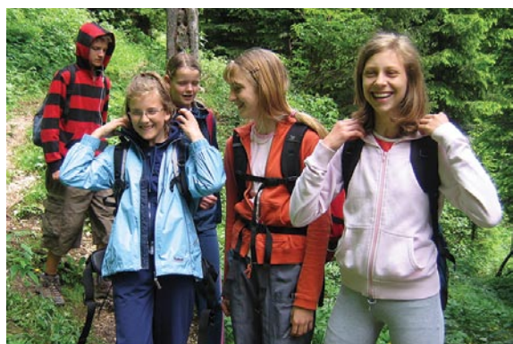
Uršlja gora (2007)