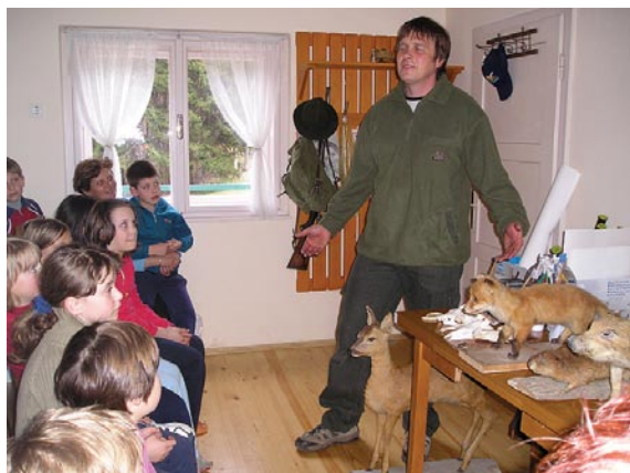
Planinski vikend 2005 - lovec na obisku