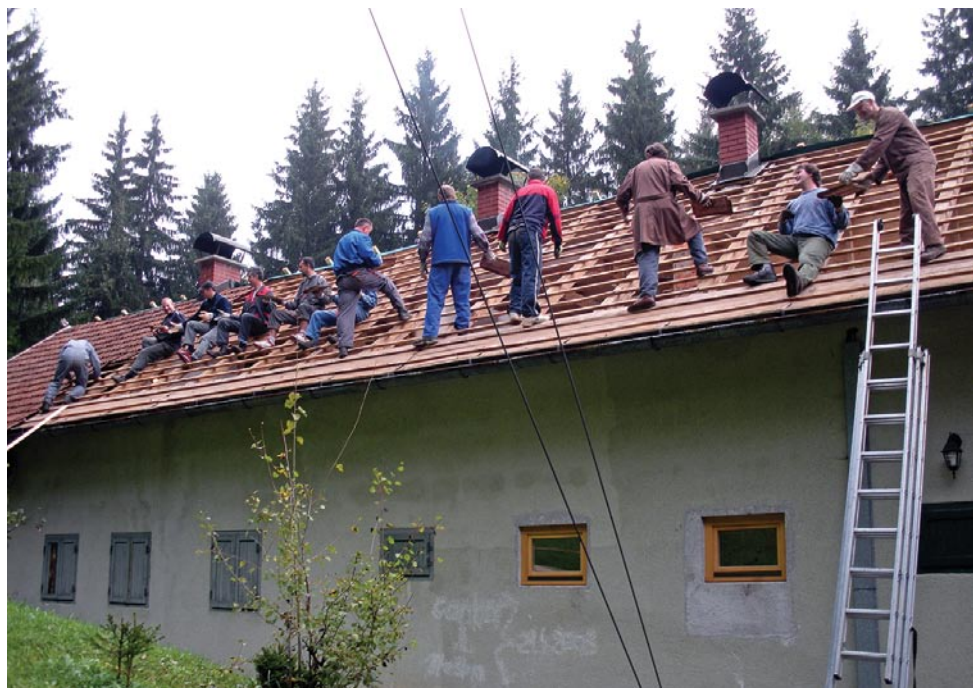
Prekrivanje strehe na Farbanci (2009)