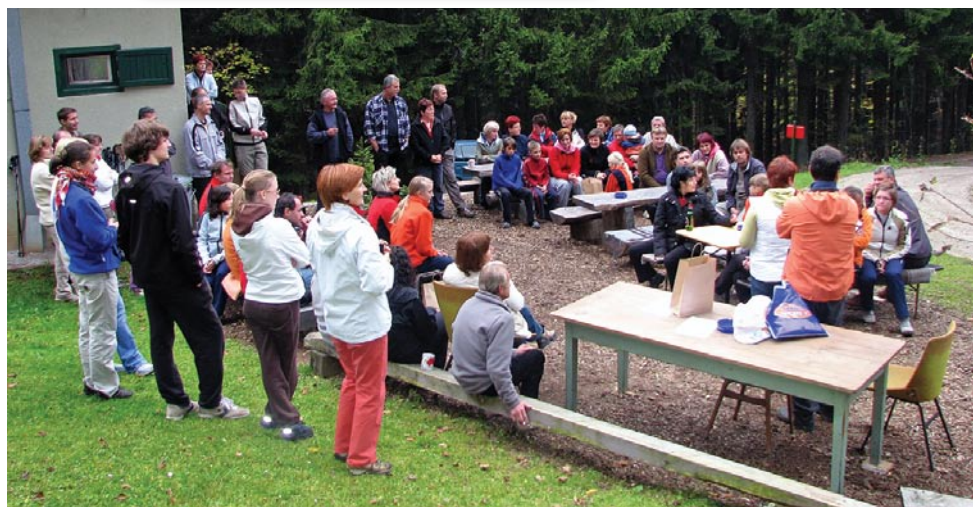
Zaključek akcije Kolesar in pohodnik 2008