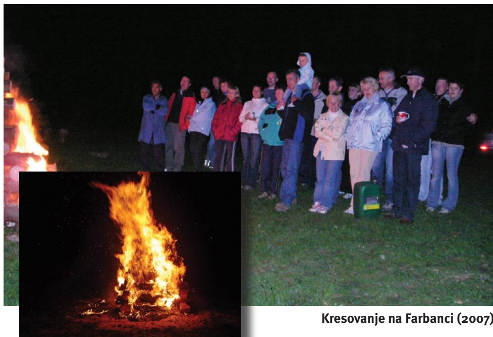
Kresovanje na Farbanci (2007)