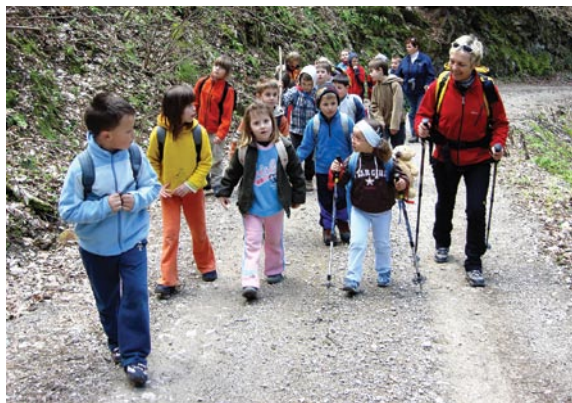
Pohod na Čreto (2008)