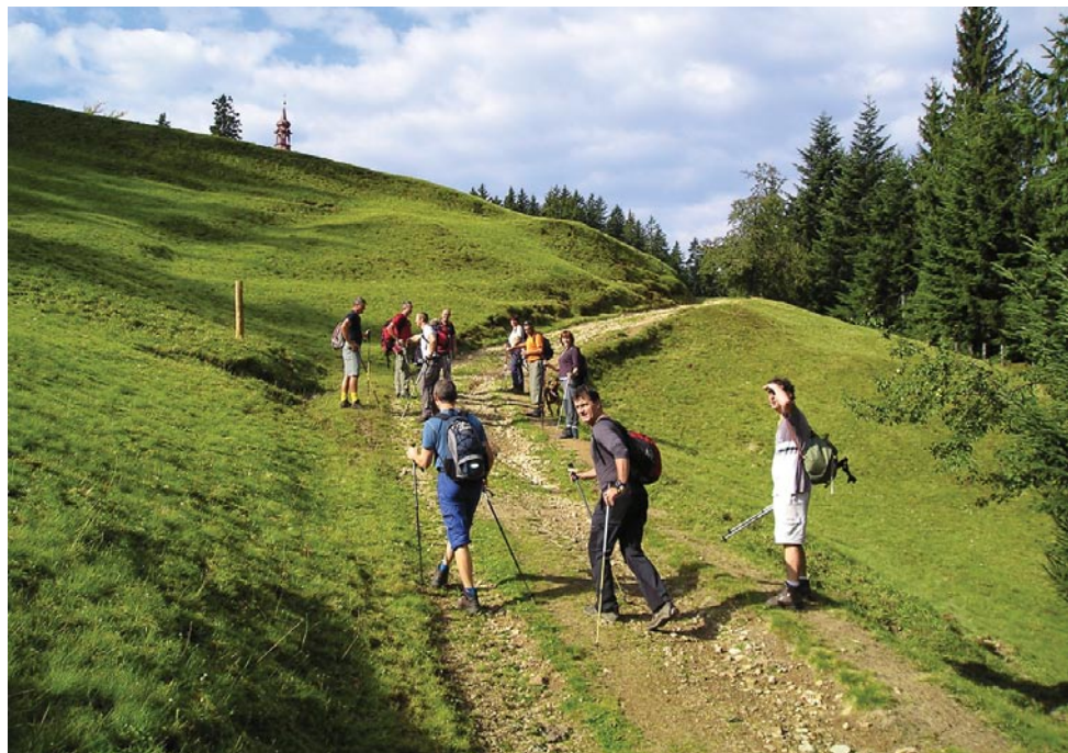
Čreta 2007 - pohod ob prazniku občine Nazarje