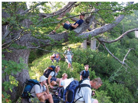
Pod Celovško kočo (2004)