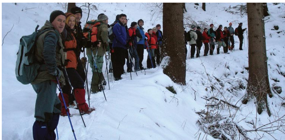
Pohod na Tolsti vrh (2009)