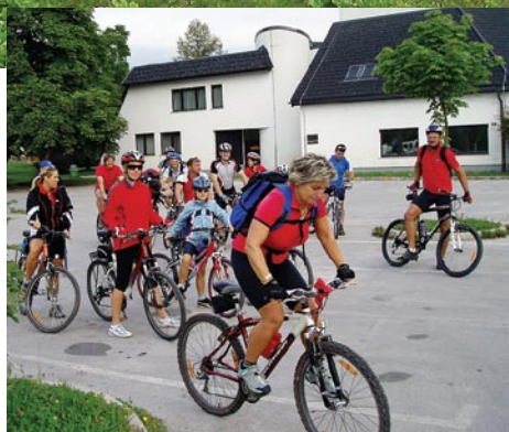
Kolo prijateljstva (2007)