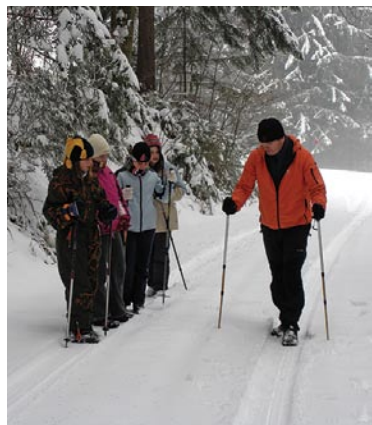
Planinska šola 2008 - učimo se hoje v zimskih razmerah