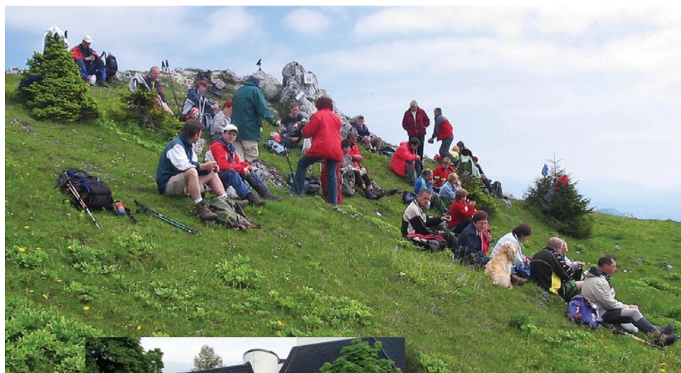
8. pohod na Goli vrh (2007)