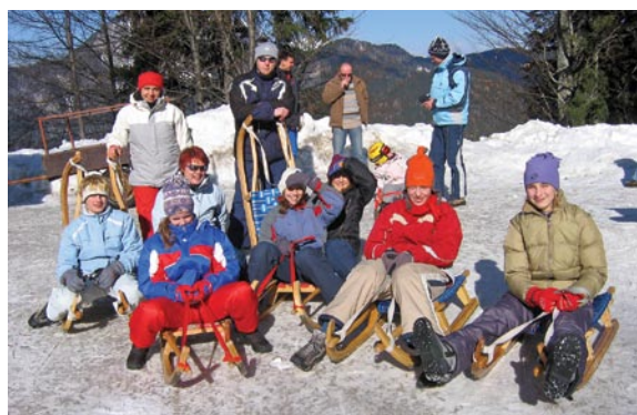
Sankanje na Jezerskem (2006)