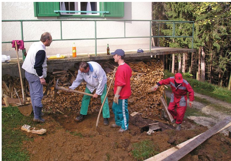
Delovna akcija 2005 - izdelava stopnic