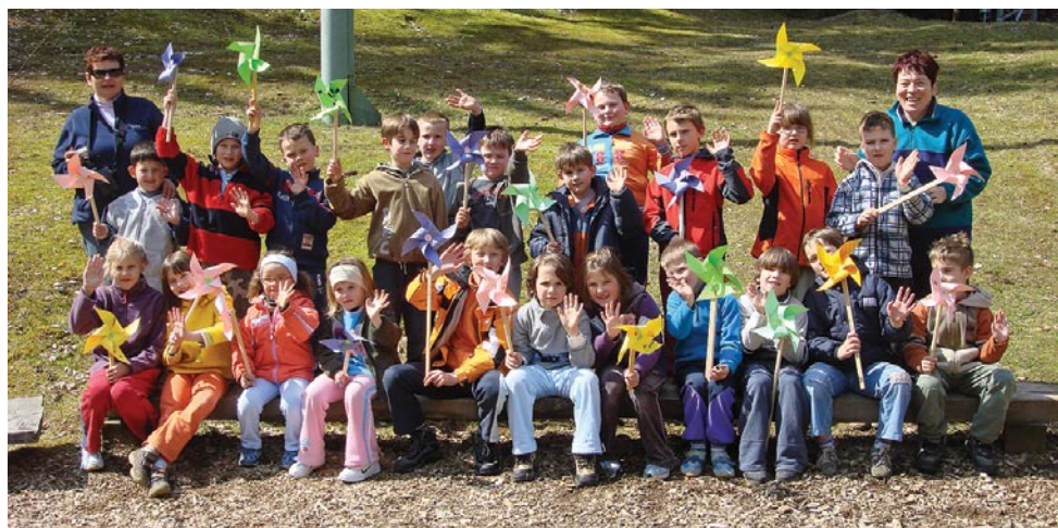
Planinski vikend otrok na Farbanci (2008)